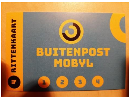
4- ritten knipkaart BUMO

Het bestuur communiceert meestal zowel via de telefonisten- alsook via de chauffeursapp met de vrijwilligers. Dit blijkt een juiste en directe manier van communicatie te kunnen zijn. De namen, adressen, telefoonnummers en mailadres zijn, met schriftelijke toestemming van de vrijwilligers, op een alleen intern te gebruiken lijst genoteerd.