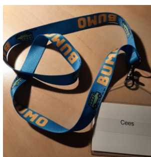
keycord en badge gedragen door de chauffeurs